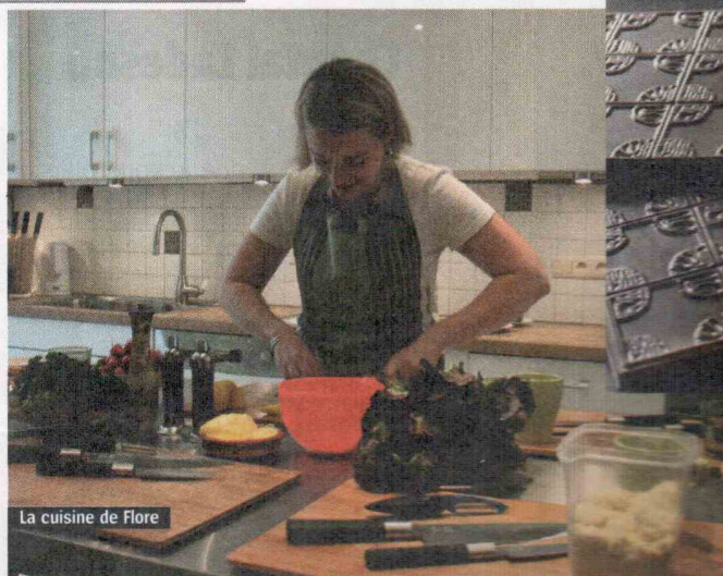
La cuisine de Flore