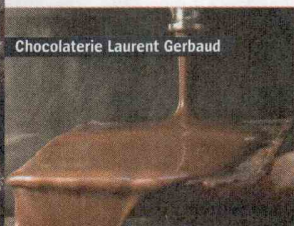
Chocolaterie Laurent Gerbaud